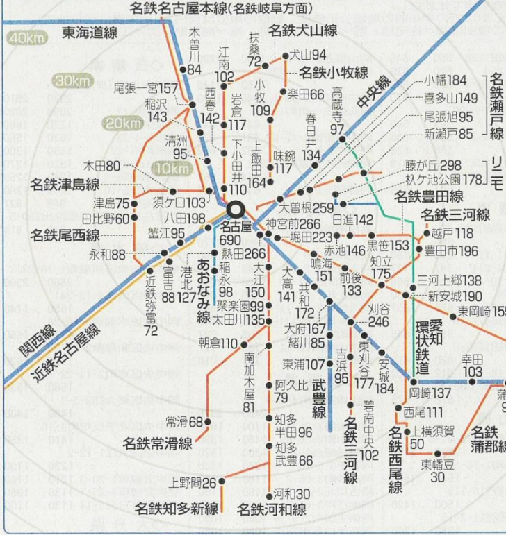
鉄道沿線別 駅周辺住宅地の平均価格(名古屋駅基点)